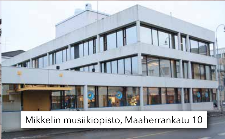
Mikkelin musiikkipisto, Maaherrankatu 10