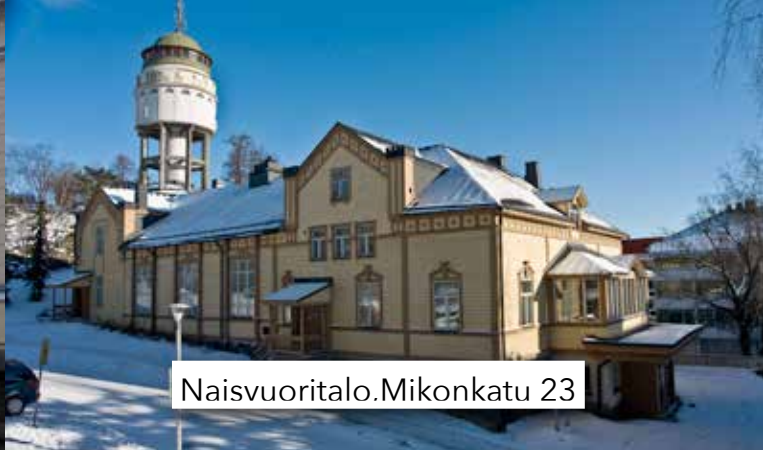
Naisvuoritalo. Mikonkatu 23