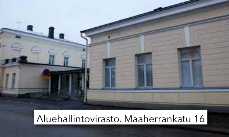
Aluehallintovirasto. Maaherrankatu 16