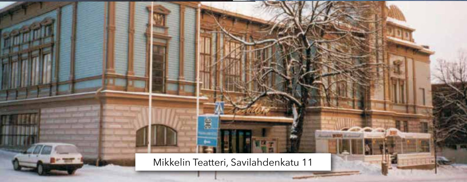
Mikkelin Teatteri, Savilahdenkatu 11