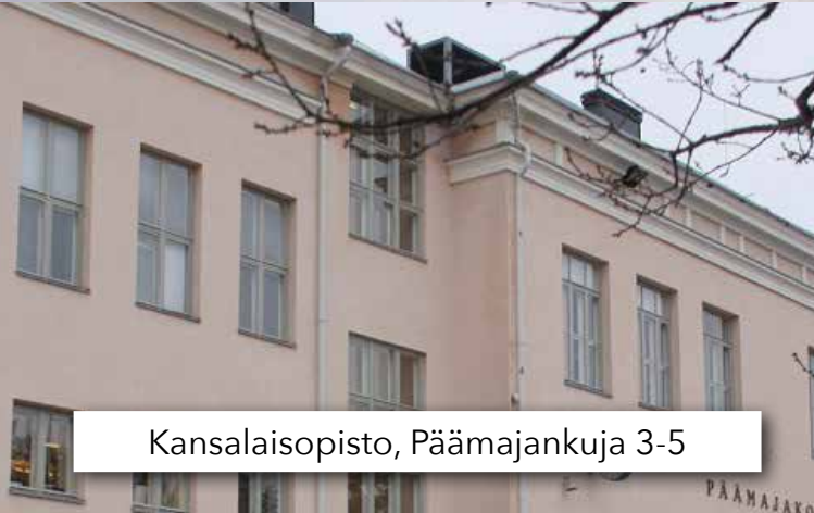
Kansalaisopisto, Päämajankuja 3-5