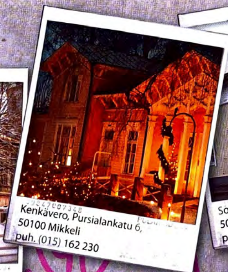
Kenkävero, Pursialankatu 6, 50100 Mikkeli puh. (015) 162 230