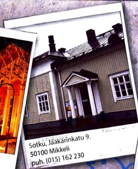
Sotku, Jääkärintatu 9, 50100 Mikkeli puh. (015) 162 230