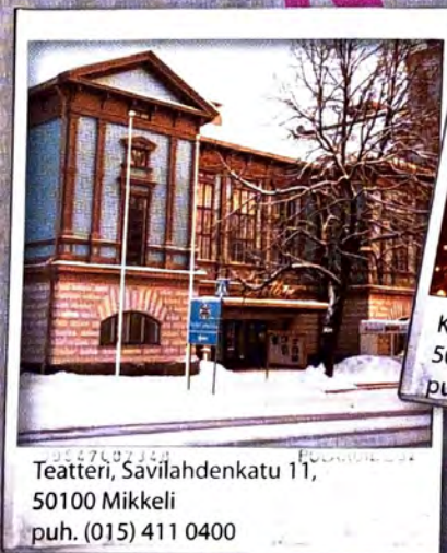
Teatteri, Savilahdenkatu 11, 50100 Mikkeli puh. (015) 411 0400

Mikkelin Teatteri suuri näyttömo (SN) ja pieni näyttömo (PN), Savilahdenkatu 11 Vanha Sotilaskoti, Sotku (SO), Jääkärintatu 9 Naisvuoritilo (NT), Mikonkatu 23 Kenkävero (KV), Pursialankatu 2