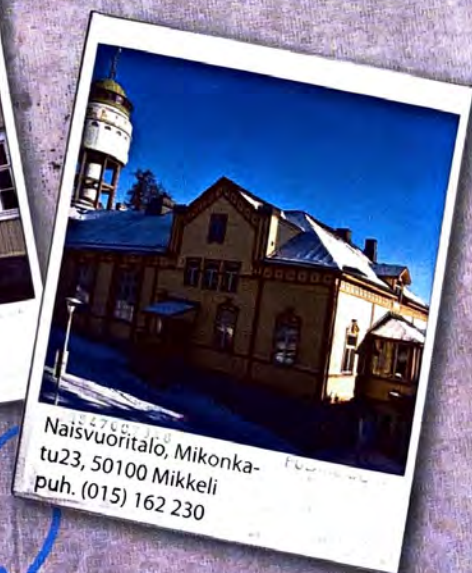
Naisvuoritilo, Mikonka- tu23, 50100 Mikkeli puh. (015) 162 230