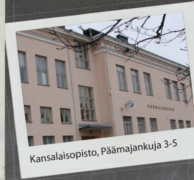
Kansalaisopisto, Päämajankuja 3-5