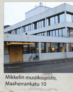
Mikkelin musiikkiopisto, Maaherrankatu 10