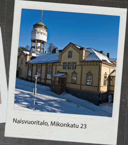
Naisvuoritalo, Mikonkatu 23