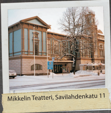
Mikkelin Teatteri, Savilahdenkatu 11

ESITYSPAIKAT Mikkelin Teatteri suuri näyttö (SN), Savilahdenkatu 11 Naisvuoritalo (NT), Mikonkatu 23 Musiikkiopisto (MO), Maaherrankatu 10 Kansalaisopisto (KO), Päämajankuja 3-5