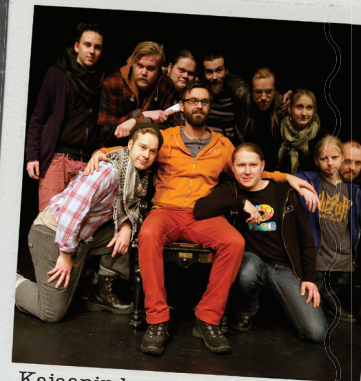
Kajaanin harrastajateatteri 2014

Omaa suosikkiesitystä voit äänestää kyseisen esityksen pääsylipulla. Kirjoita lipun taakse yhteystietosi (nimi ja puhelinnumero), jos haluat osallistua lippupaketin arvontaan (6 lippua seuraaville Näyttämöpäiville).